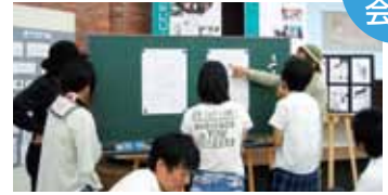
在学生とのマンガバトル!