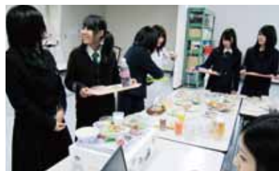
フードモデルを用いた栄養診断