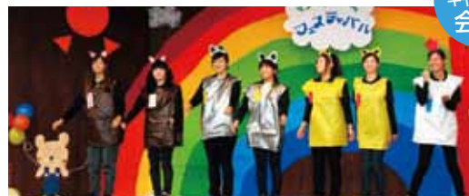
ふれあい遊び研究会の様子