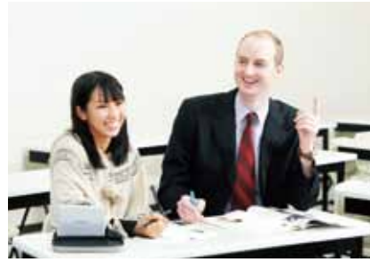
オカナ先生の“アイルランドあるある！”