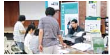
オリジナルデザインのグッズ作り