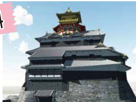
信長の安土城イメージ (バーチャルリアリティ安土城プロジェクトより)