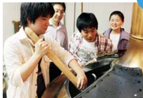
地ビール工場で仕込み体験