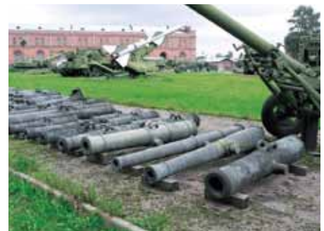
ロシアの博物館に保存されている日本の大砲