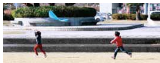
たこを作って飛ばしてみよう!