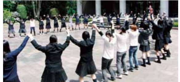
みんなで輪になって