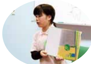
絵本の読みきかせ